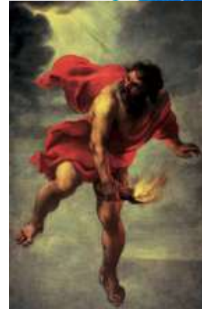
Я. Коссирс «Прометей, який несе вогонь на Землю» (1637)