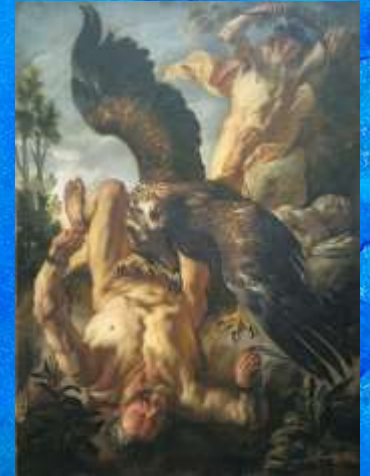
Я. Йорданс «Прометей закутий» (1640)