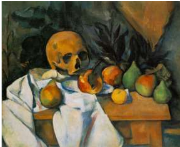
Поль Сезанн «Натюрморт з черепом»