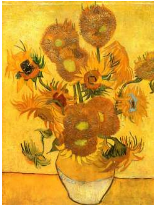
Вінсент Ван Гог «Соняшники»