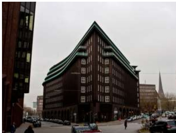
Офісна будівля Чилихаус в Гамбурзі (Німеччина)