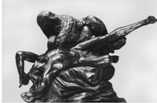
Ф. Гордєєв (1769)