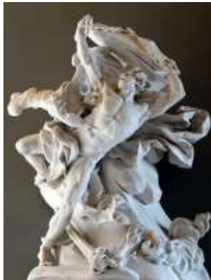
Н.-С. Адам (1762)