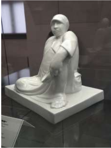
Барлах «Жебрачка з чашею для милостині»