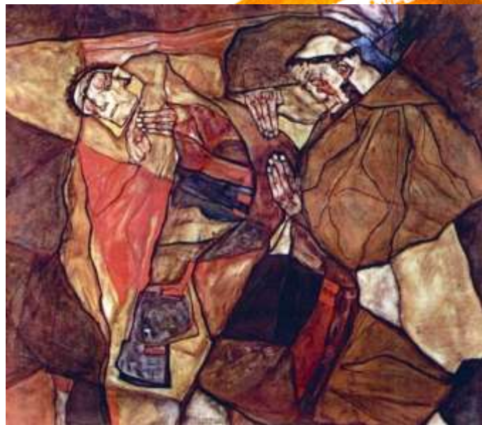
Егона Шиле «Агонія»