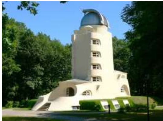
Башта Ейнштейна в Потсдамі