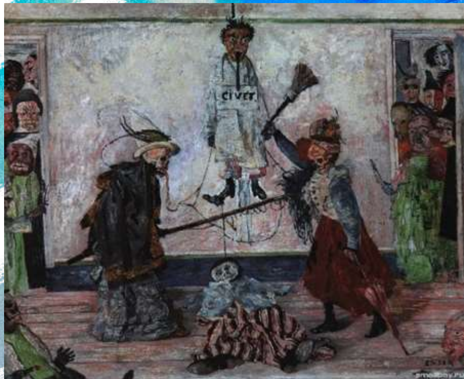
Джеймс Енсор «Скелети, що борються за тіло повішеного»