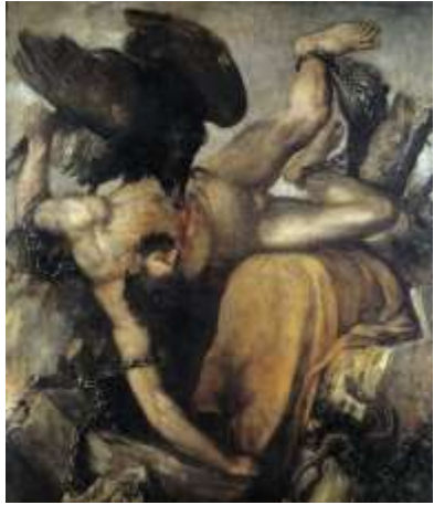
Тіціан «Прометей» (1548-1549)