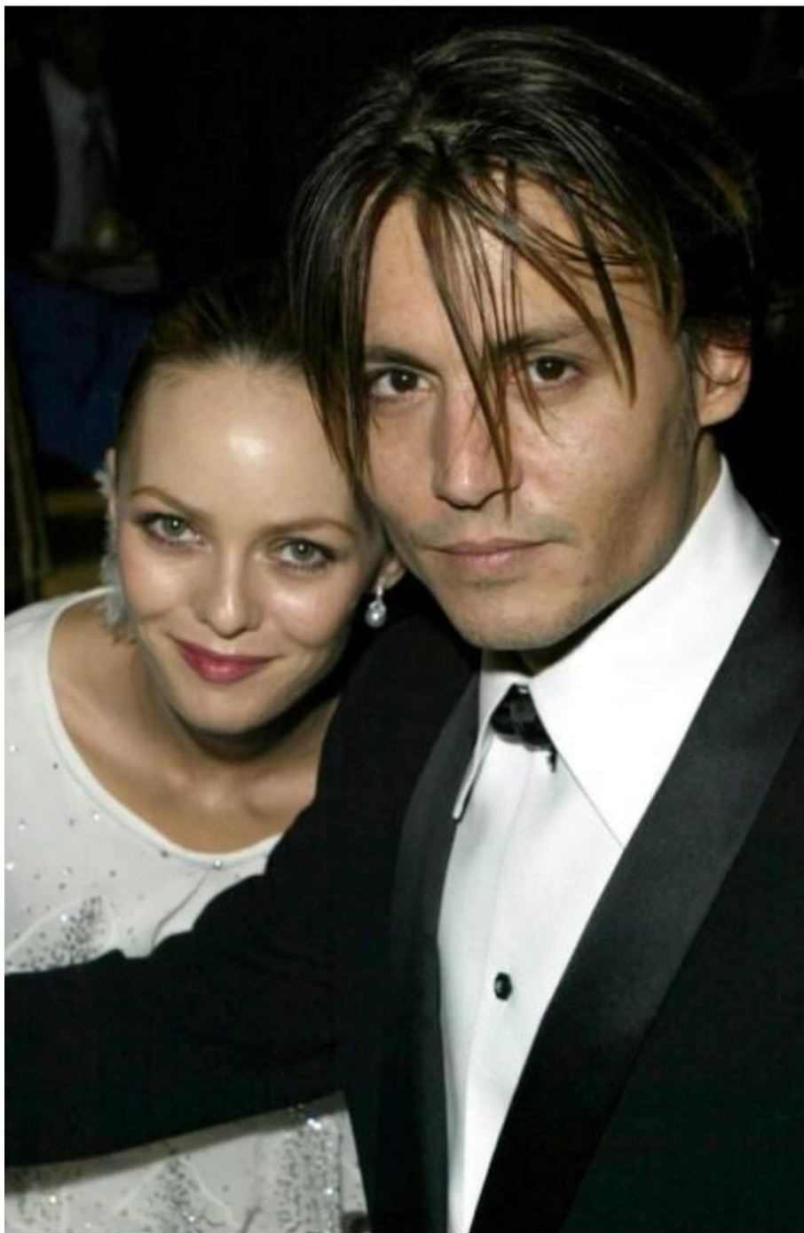
Лілі Роуз Мелоді Депп

його житті, буквально врятувала його з темряви. Поява Ванесси дозволила акторові забути минулі невдалі стосунки.